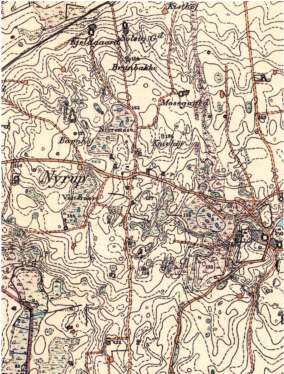
Matrikelkort – udsnit. Nyrup 1814-1844