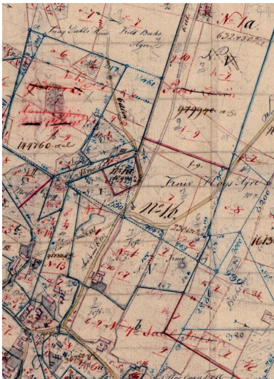
Figur 1 Nyrup tegnet 1814 og efterfølgende redigeret (udsnit).